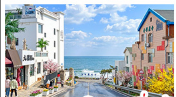
ถนนคอบเพลิงสายที่เปิด