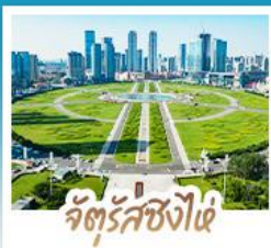
จัตุรัสซิงไ่