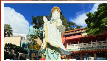
เจ้าแม่กวนอิมรัฟส์เบย์