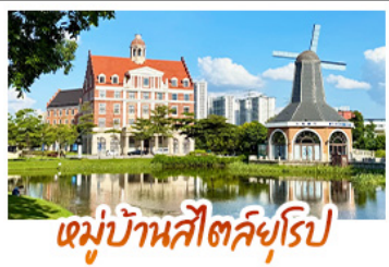
หมู่บ้านสไตล์ยุโรป

16 - 21 ต.ค. 69 22,900 20 - 25 ต.ค. 69 22,900 24 - 29 ต.ค. 69 22,900 26 - 31 ต.ค. 69 22,900