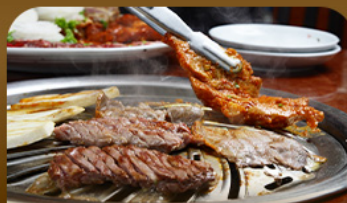
เมนูย่างสไตล์เกาหลี