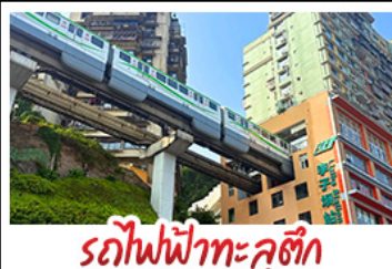
รถไฟฟ้าทะเลอูตัก