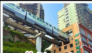
รถไฟฟ้าทะลุคิ๊ต