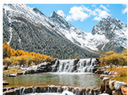
อุทยานปี่เฉิงโกว