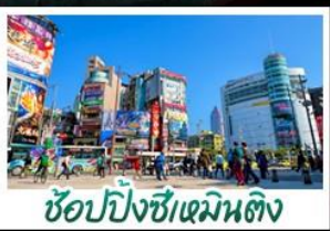
ซ้อปั้งซีเหมินตัง