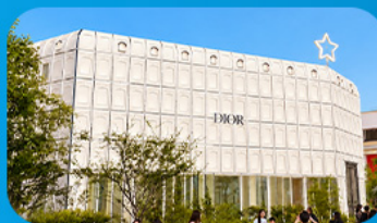
บรูกลินเกาหลี