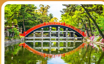
ศาลเจ้าสุมิโยชิ โกะ