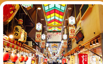
ตลาดปลาชิคิ