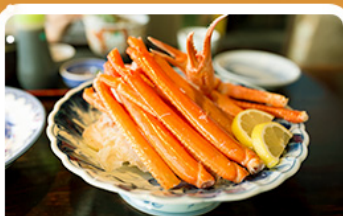
พิเศษ! ขาปู