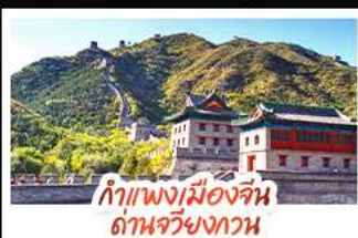
กำแพงเมืองจีน ด่านจวิ่งกวน

ส่องเรือสุดโรแมนติกแม่น้ำหวงผู้ ปักกิ่ง...เปิดประตูสู่แดนมังกร ด้วยความอลังการระดับจักรพรรดิ ชิงเต่า...เมืองชายทะเลสไตล์ยุโรป หอระฆังแบบพอนคลาย เซี่ยงไฮ้...มหานครแห่งเอเชีย เมืองที่ไม่เคยหลับใหล