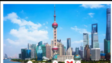
ถ่ายรูปตอไข่มุก