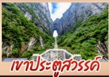
เขาประตูสวรรค์