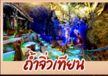
ถ้ำจิวเทียน