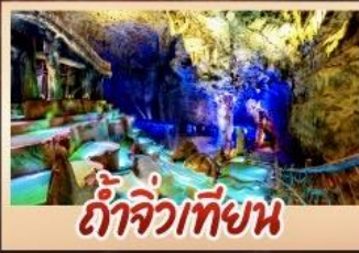
ถ้ำจิวเทียน