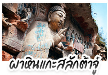
พาเดินแกะสลักต้าจู้