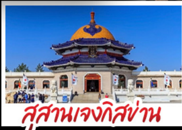
สุสานเจกิสข่าน