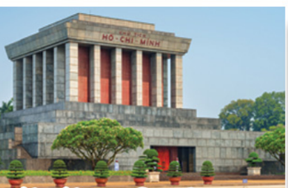
จัตุรัสบาติงห์