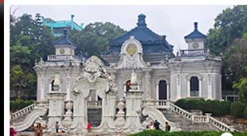
พระราชวังหยวนหมิงหยวน