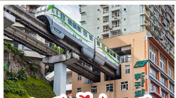
สถานีรถไฟทะเลลึก

11 - 15 มิ.ย. 69 21,888 13 - 17 มิ.ย. 69 20,888 18 - 22 มิ.ย. 69 21,888 20 - 24 มิ.ย. 69 20,888 25 - 29 มิ.ย. 69 21,888 27 มิ.ย. - 01 ก.ค. 69 20,888