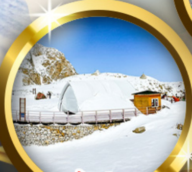
ธารน้ำแข็งต่ากู่