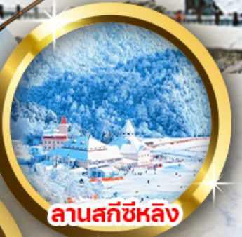
ลานสกีซีหลิง