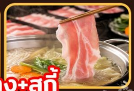
เปิดย่าง+สุกั๊