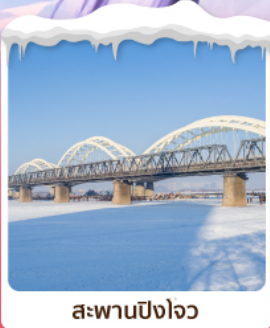
สะพานปิงโจว

• โฮเทล ชมความอลังการเทศกาลคอมไฟน์น้ำแข็ง เที่ยวชมหมู่บ้านหิมะ เช็กอินจุด CHINA'S SNOW TOWN ลานสกียาปูลี