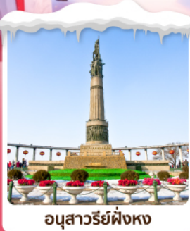
อนุสาวรีย์ผิงหง