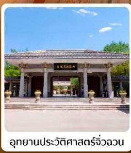
อุทยานประวัติศาสตร์จิวจวน

ไฮไลท์! เขตท่องเที่ยวอู๋เจียงจางหม่า ชมทุ่งหญ้าและภูเขาสวยแห่งถนนซู่ ภูเขาสายรุ้งจางเย่ต้นเสี่ย "มหัศจรรย์ภูเขาสายรุ้งหลากสี"