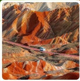
ภูเขาสายรุ้งจากเข้