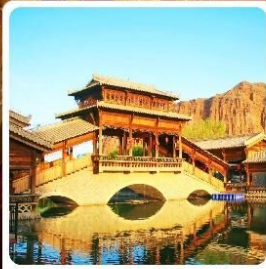
เมืองเล็กตั้นเสี่ยโซ่ว