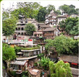
ตรอกโบราณเซี่ยฮ่าวหลี่