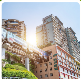
รถไฟทะเลสุดคึก