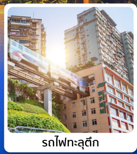
รถไฟฟ้าลูตึก