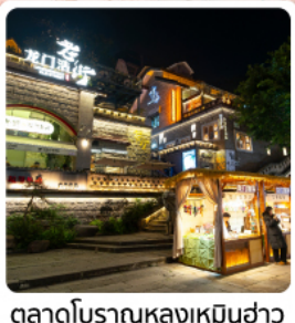
ตลาดโบราณหลงเหมินฮ่าว

ไฮไลท์ อุทยานเขานางฟ้า อุทยานแห่งชาติหลุมฟ้า 3 สะพานสวรรค์ พาหิณแคะสลักตัวภูเขาป่าตึ๊งชาน มรดกโลกระดับ 5 A