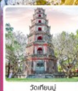
วัดเทียนมู่