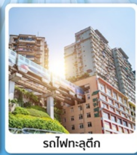
รถไฟกะลุดิก