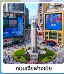
ถนนเจี่ยฟางเป่ย์