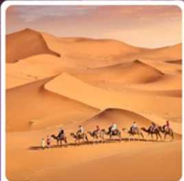
ทะเลทรายเสียนชวาน