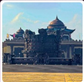
ศูนย์วัฒนธรรมหยวนหยิว