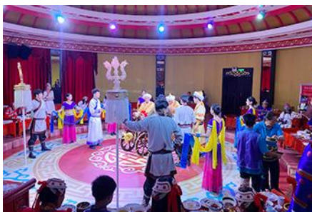
Mongolian Gala Dinner

那达慕 Naadam Festival หรือเทศกาลเฉลิมฉลองที่คล้ายวันตรุษจีนของชาวจีน ประกอบด้วยกิจกรรมการละเล่นพื้นเมืองแบบมองโกล รวม 22 อย่าง ได้แก่ พิธีแต่งงานเออร์คอส / การขี่ม้าในสนาม / ปาร์ตี้รอบกองไฟ / ขี่ม้าถ่ายรูป / สไลเดอร์หญ้า / รถลางทุ่งหญ้า / สวนแขวงกต/สวนเด็กเล่น / ตีกอล์ฟทุ่งหญ้า / รถบัมเปอร์ / รถโกคาร์ท / โยนบอลทุ่งหญ้า / ปีนไฟมองโกล / ยิงธนูในร่ม / แข่งขันจับแกะ / คล้องม้าจำลอง / หมูเลี้ยงนำอินตุ / เครื่องเล่นหมุน / เลี้ยงแกะโยน / ยิงธนู / ทอยแจกัน / เซ็นต์ชื่อภาษา มองโกล ให้เลือกเล่นได้ 12 อย่างตามรายการที่ระบุ.....อัตราค่าบริการสำหรับ 那达慕 Naadam Festival 380 หยวน หรือ 1,900 บาท/ท่าน (สำหรับลูกค้าทัวร์ที่ไม่ซื้อโปรแกรมเสริม สามารถเดินเล่น ถ่ายรูปบริเวณทุ่งหญ้าหรือพักผ่อนตามอัธยาศัย)