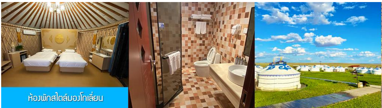
ห้องพักสไตล์มองโกลเลียน