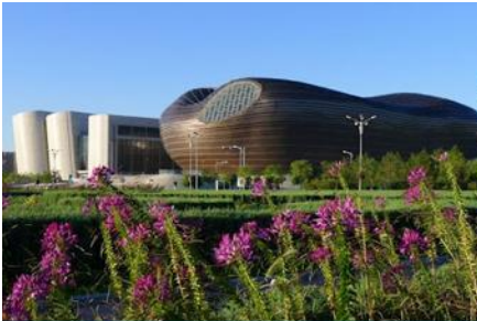
อุทยานคังปาสือ