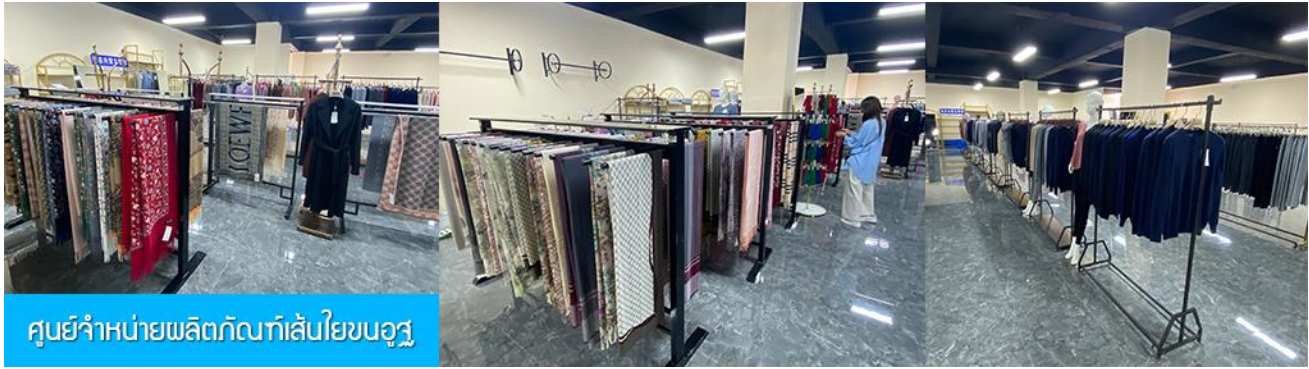
ศูนย์จำหน่ายผลิตภัณฑ์เส้นใยขนอูฐ