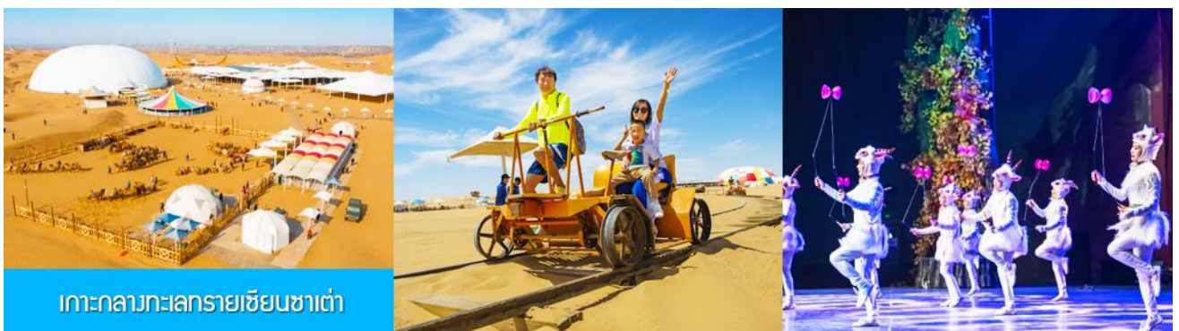
เกาะกลางทะเลทรายเซียนซาเต๋า