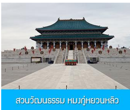
สวนวัฒนธรรมหมงกุ๋หยวนหลิว

พักที่ ORDOS BOYU AIRUI HOTEL โรงแรมระดับ 4 ดาวท้องถิ่น หรือเทียบเท่าในเมืองเออร์ดอส