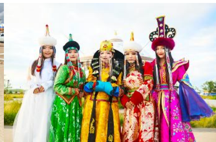
แต่งชุดพื้นเมืองมองโกล