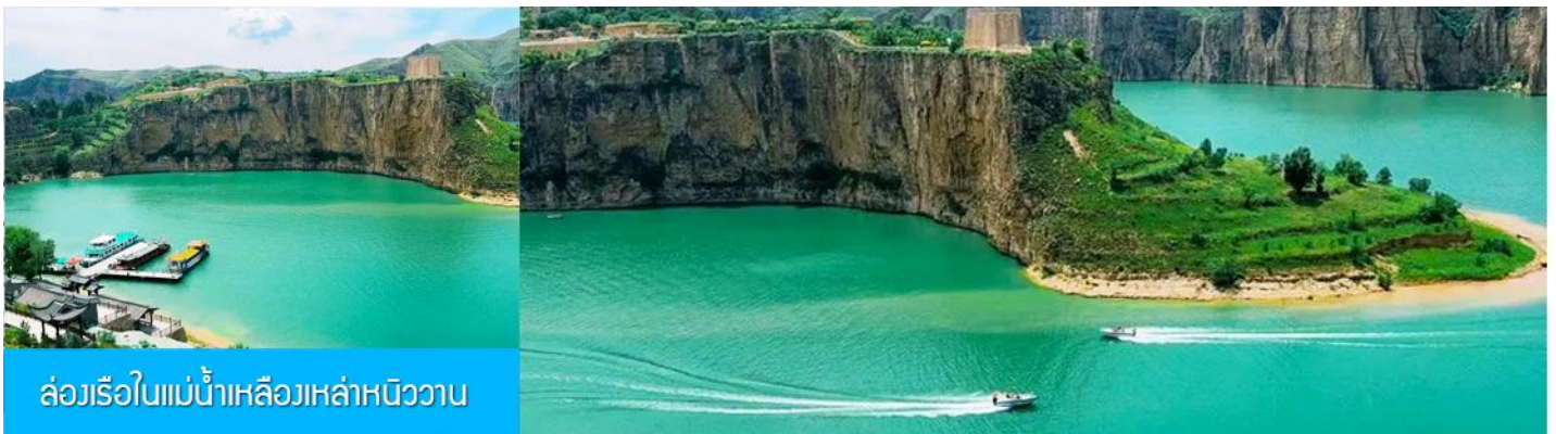
ล่องเรือในแม่น้ำเหลืองหล่าหนิววาน

รับประทานอาหารกลางวัน ณ ร้านอาหารระหว่างทาง (8)