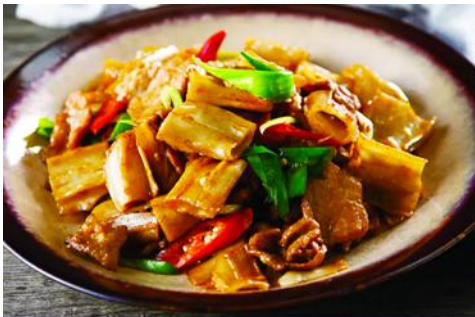
ถนนคนเดินเออร์ดอส

จากนั้นนำท่านเที่ยวชม อุทยานคังปาสือ 康巴什景区 เป็นเขตเมืองใหม่ที่ถูกเนรมิตรขึ้นและได้รับการขึ้นทะเบียนเป็นอุทยานท่องเที่ยวระดับ 4A และเป็นศูนย์กลางความเจริญของเมืองเออร์ดอส ประกอบด้วยจัตุรัส ธีมปาร์ก พิพิธภัณฑ์ แกรนด์เธียร์เตอร์ ศูนย์วัฒนธรรม และสนามแข่งรถนานาชาติ นำท่านนั่งรถผ่านชมจัตุรัสรัฐบาล ทะเลสาบอูหลันมู่ สวนศิลปะงานปาติมากรรมเอเชีย ฯลฯ