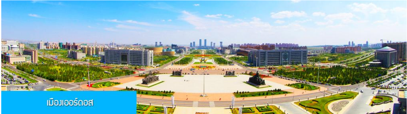
เมืองเออร์ดอส