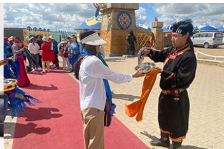
พิธีต้อนรับแขกด้วยเหล้า