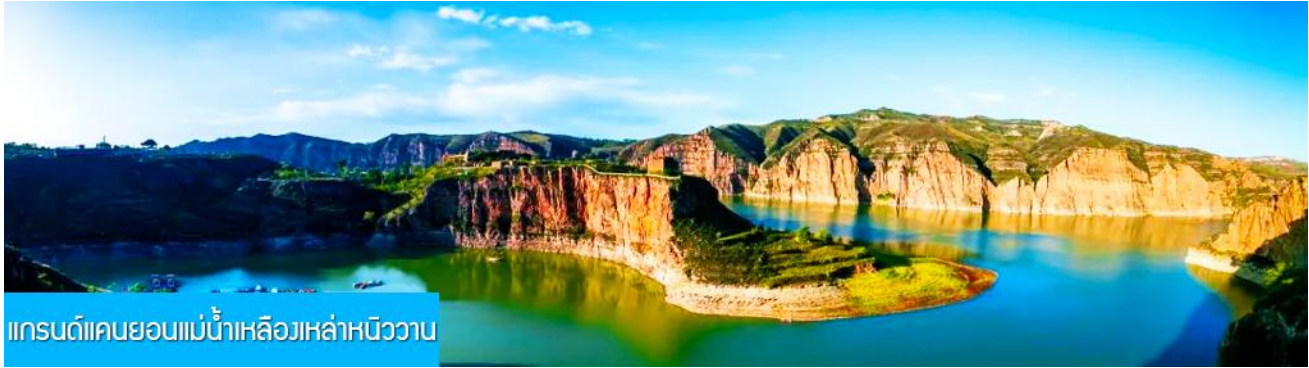
แกรนด์แคนยอนแม่น้ำเหลืองหล่าหนิววาน

พักที่ DALATEQI SHNAGJING HOTEL โรงแรมระดับ 4 ดาวหรือเทียบเท่าในเมืองต้าลาเพื่อ