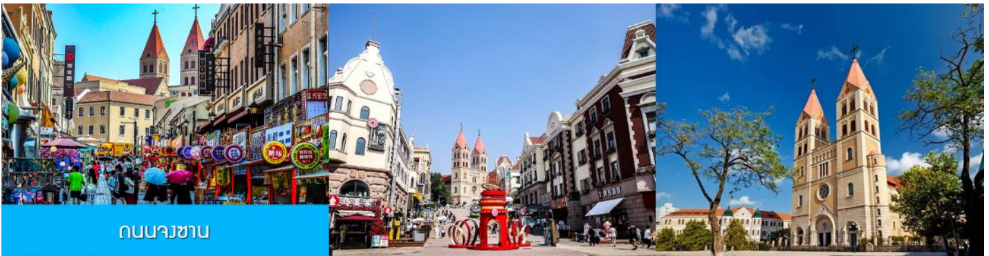
ถนนวงเวียน

จากนั้นเดินทางต่อสู่ย่าน เมืองเก่าเยอรมัน ตรอกกว้างชิงหลี่ 广兴里 ตรอกชอกชอยที่เรียงรายไปด้วยอาคารสถาปัตยกรรมแบบผสมผสานจีนและอาคารสไตล์ยุโรป