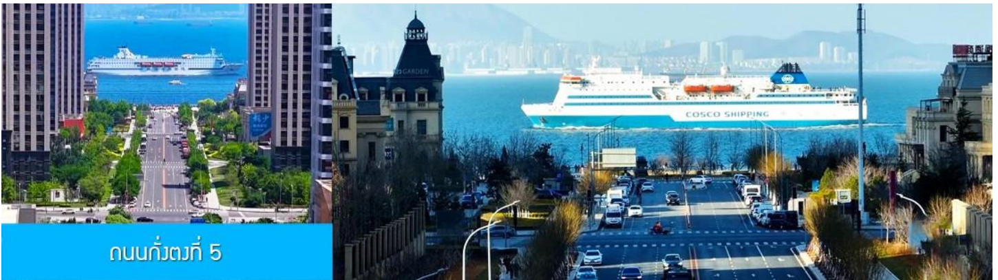
ถนนกังตงที่ 5

หลังอาหารนำท่านเที่ยวชม ถนนกังตงที่ 5 港东五街 จุดเช็คอินใหม่ที่ได้รับความนิยมอย่างสูงจากนักท่องเที่ยว และชาวเมืองต้าเหลียน จุดนี้เป็นช่วงที่ถนนสายกังตงที่ห้า มุ่งตรงสู่ทะเล(มองจากจุดชมวิวที่อยู่ด้านบน) เสมือนว่าปลายทางของถนนไปสิ้นสุดในทะเล อีกด้านจะมองเห็นท่าเรือและอาคารสถาปัตยกรรมตะวันตกเป็นกรอบของมุมมองที่งดงาม เมื่อมีเรือแล่นมาผ่านทะเลตรงบริเวณนี้ จะเป็นภาพที่สวยงามและโรแมนติก