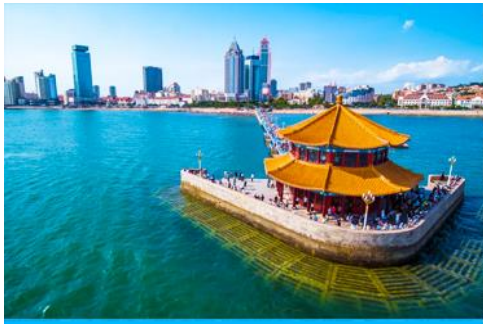
สะพานจ้านเจียว