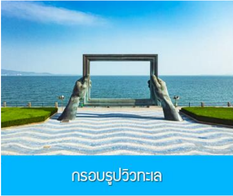
กรอบรูปวิวกทะเล