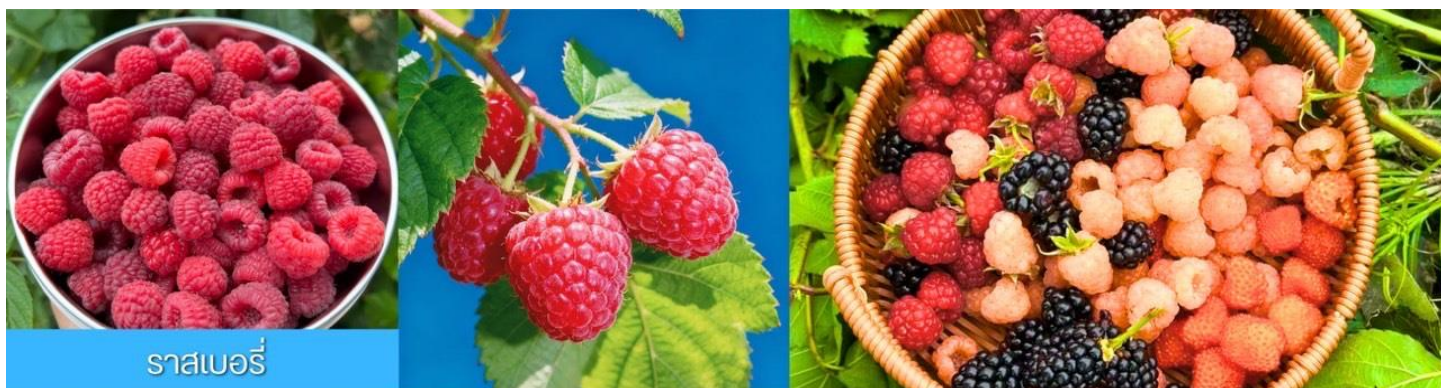
ราสเบอร์รี่