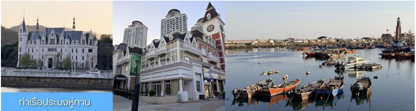
ท่าเรือประมงหู่ทาน

วันที่สาม เมืองต้าเหลียน- ท่าเรือประมงหู่ทาน- อ่าวหลังเจี้ยว- พิพิธภัณฑ์ต้าเหลียน-ถนนกั๋งตงที่ 5- เมืองวนิสตะวันออก-ไกด์ขายออฟชั่นนั่งเรือให้อาหารนก -ท่าเรือต้าเหลียน-เยียนไถ (พักค้างคืนบนเรือ)