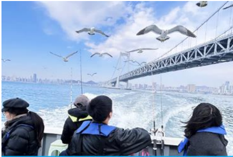
นั่งเรือใบออกทะเลลี้ยนกนางนวล