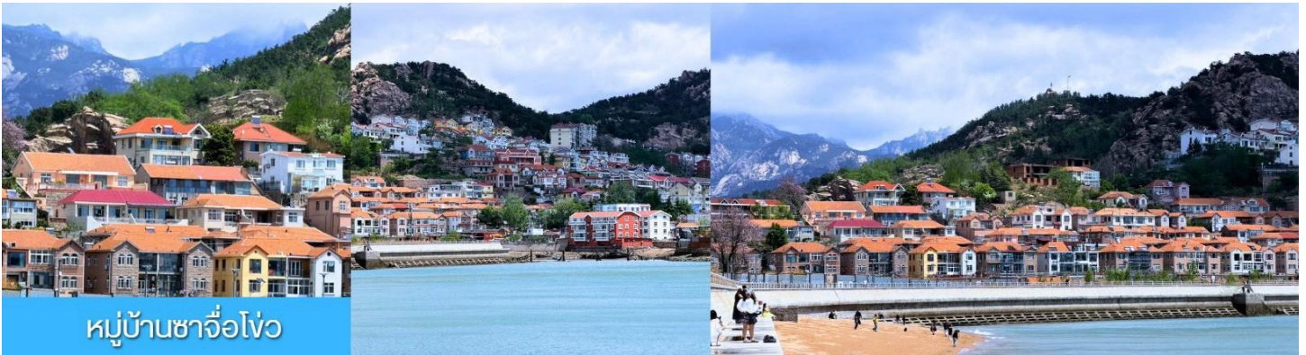
หมู่บ้านชาวโจว