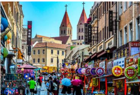
ถนนนางซาน

หลังอาหารนำท่านเดินทางชม สะพานจ้านเถียว 栈桥 เป็นแลนด์มาร์คแห่งประวัติศาสตร์คู่เมืองชิงเต่า สร้างเมื่อปี ค.ศ.1891 มีลักษณะเป็นสะพานหินทอดยาวกว่า 440 เมตรสู่ทะเล ปลายสะพานมีศาลา ทรงแปดเหลี่ยมสีแดงที่โดดเด่น ซึ่งเป็นสัญลักษณ์บนฉลากเบียร์ชิงเต่า ขึ้นชื่อเรื่องวิวสวย รับลมทะเล ให้ท่านเก็บภาพบรรยากาศ