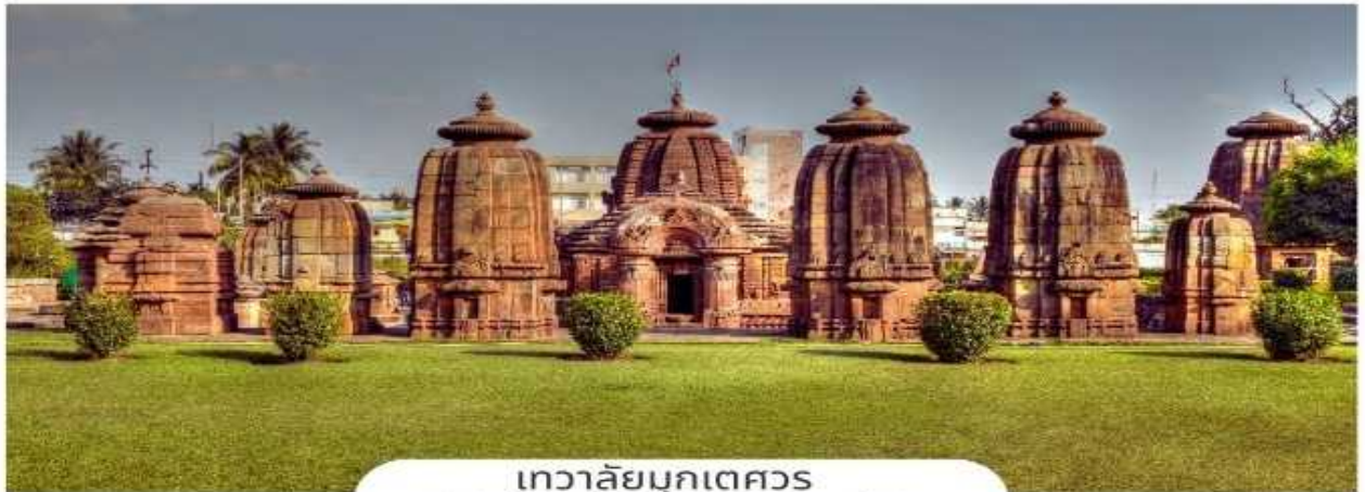
เทวาลัยมุกเตศวร (Mukteshvara Temple)

ซึ่งคล้ายกับภาษาไทยคำว่า วิมาน นั่นเอง ที่มียอดคล้ายฝักข้าวโพด หรือถูกเรียกว่า บาดา (Bada) ที่มีความสูง 18 เมตร และอีกอาคารหนึ่งถูกเรียกว่า หอชมการแสดง หรือถูกเรียกว่า จากาโมฮานา (Jagamohana) โดยมีปรางค์เป็นยอดหรือหลังคาของอาคาร