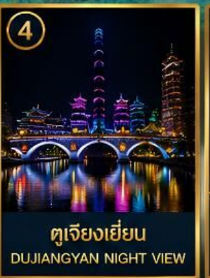
4 ตูเจียงเยียน DUJIANGYAN NIGHT VIEW