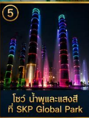
5 โซน น้ำพุและแสงสี ที่ SKP Global Park