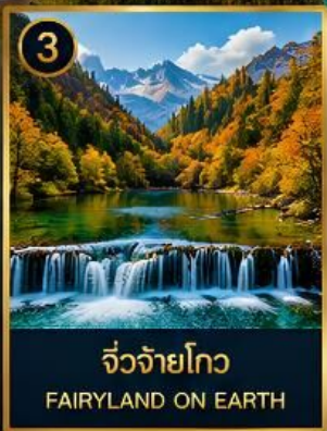
3 จิวจ้ายโกว FAIRYLAND ON EARTH