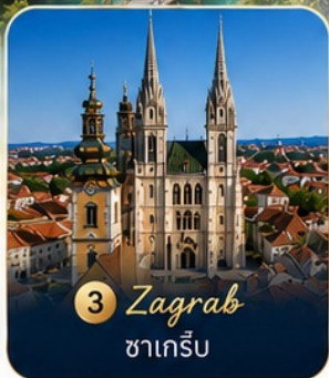
3 Zagreb ซาเกร็บ