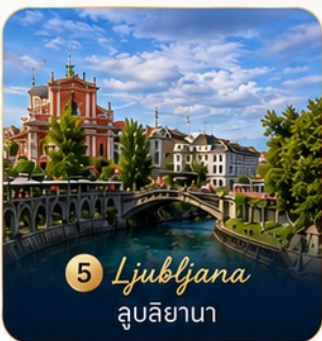
5 Ljubljana ลูบลียานา