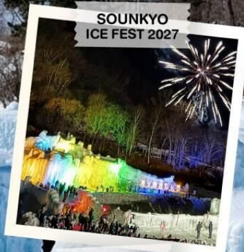
SOUNKYO ICE FEST 2027

TOMAMU / FURANO / BIEI / SOUNKYO / ASAHIKAWA BIBAI / JOZANKEI / OTARU / SAPPORO