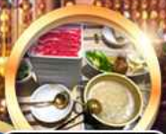
บุฟเฟ่ต์ชาบู เบียร์ไม่อั้น!!