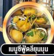
เมนูซีฟู้ดสลัดสมุนไพร