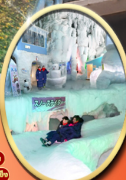
Kamikawa Ice Pavilion