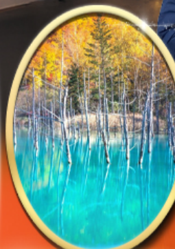
Shirogane Blue Pond