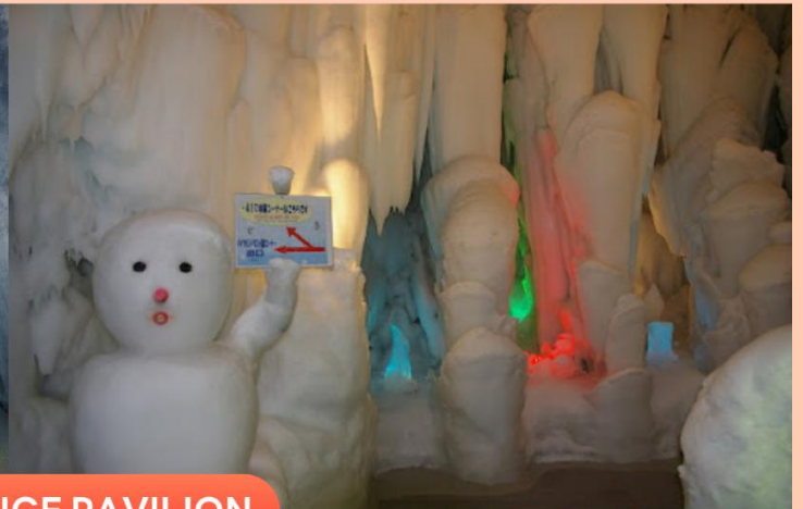
KAMIKAWA ICE PAVILION