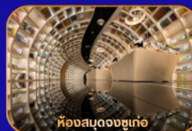
ห้องสมุดจงซูเกอ