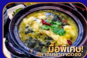
มีพิเศษ! ปลาต้มผักกาดดอง