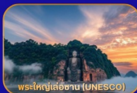
พระใหญ่เล่อซาน (UNESCO)