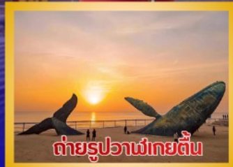
ต่ายรูปวาฬยักษ์ตื่น