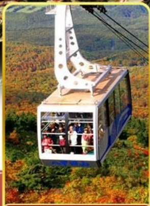
นั่งกระเช้าอากิโกะ