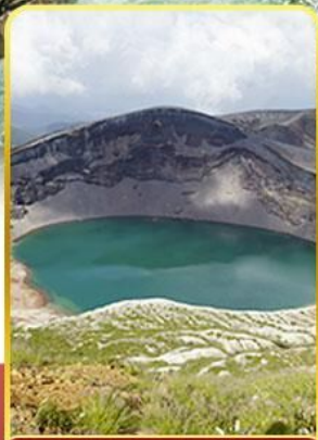
ปากปล่องภูเขาไฟฮาโอะ