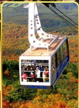
นั่งกระเช้าอิกโกะ