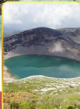
ปากปล่องภูเขาไฟฮาโอะ