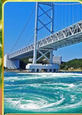
ช่องแคบนารุโตะ