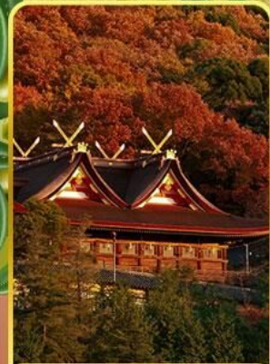
ศาลเจ้าคิบิฮิโกะ