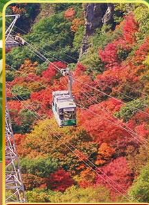
กระเช้าหุบเขาคังคาเคอิ