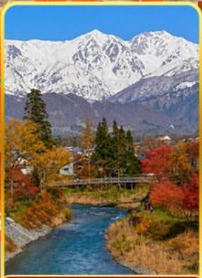
โออิเดะพาร์ค