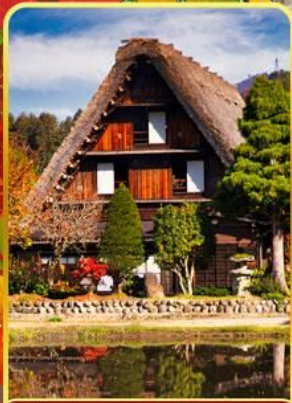
หมู่บ้านชิราคาว่าโกะ