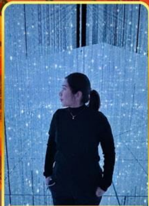
ทีมแอปโตเกียว