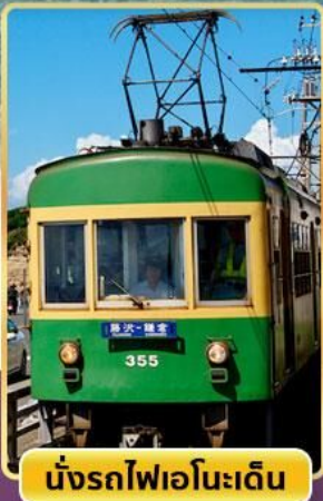
นั่งรถไฟเอโนะเด็ง