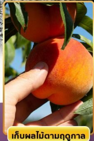
เก็บผลไม้ตามฤดูกาล