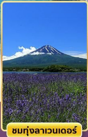
ชมทุ่งลาเวนเดอร์