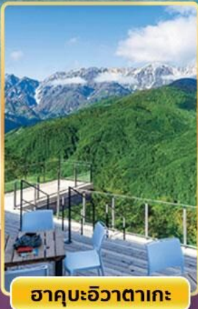
ฮาคุบะฮิวาตากะ