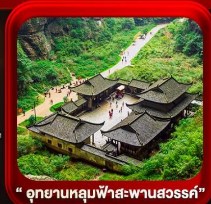
“ อุทยานหลุมฟ้าสะพานสวรรค์ ”