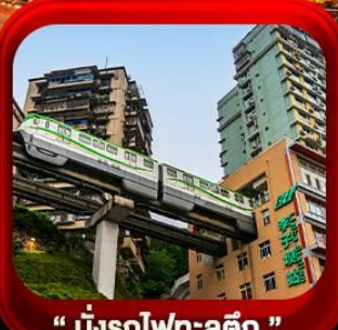
“ นั่งรถไฟทะเลสาบ ”