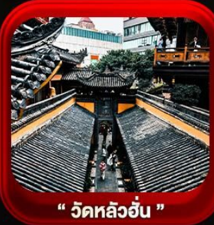
“ วัดหลิวฮั่น ”