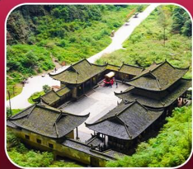
“อุทยานหลุมฟ้า”