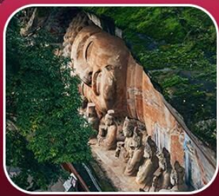
“ผาหินแกะสลักต้าจู้”