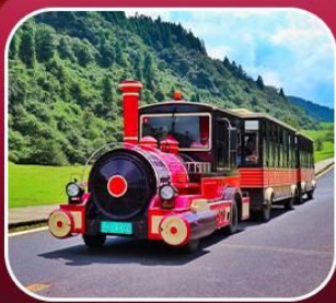
“อุทยานเขานางฟ้า”