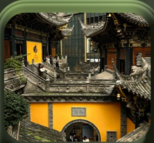
“ วัดหลัวฮั่น ”