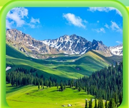
"กุ้งหน้านาราตี"