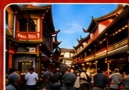
ตลาดร้อยปีเงินหวังเหมียว