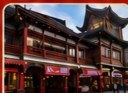
ถนนหวังฝูจิ่ง